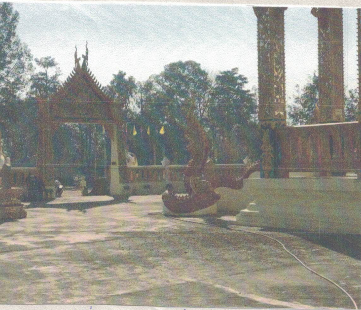
ภาพที่ ๗ สานบ.บริเวณโบสถ์ก่อนทำ