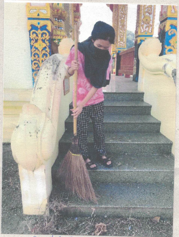
ภาพที่ 2 กวาดดูทางลาด้านนวงโบรด์