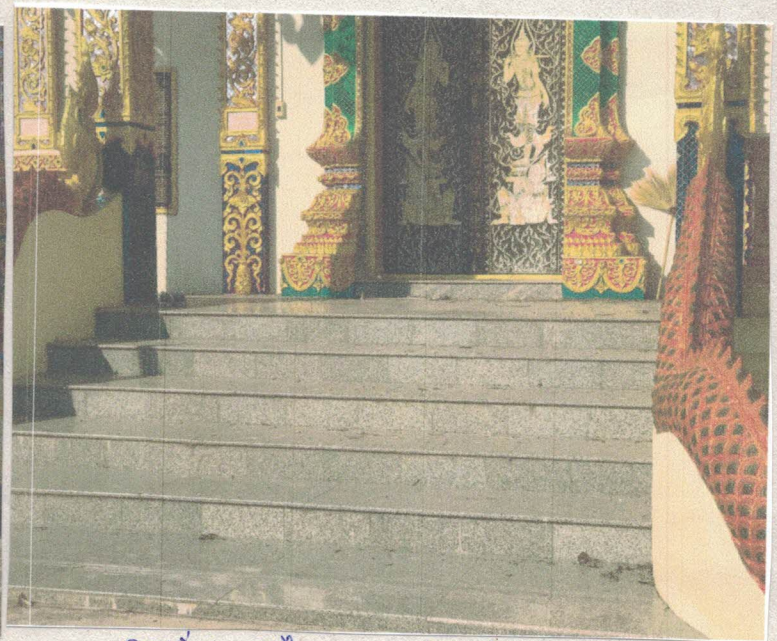
ภาพที่ ๘ บันไดด้านหน้าโบสถ์

พื้นที่ไม่พอติดภาพให้ใช้กระดาษติดภาพเพิ่ม