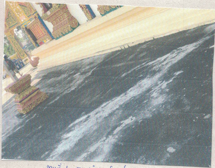
ภาพที่ 6 สานบ.บริเวณโบสถ์แล้ว ห้าง ทาง