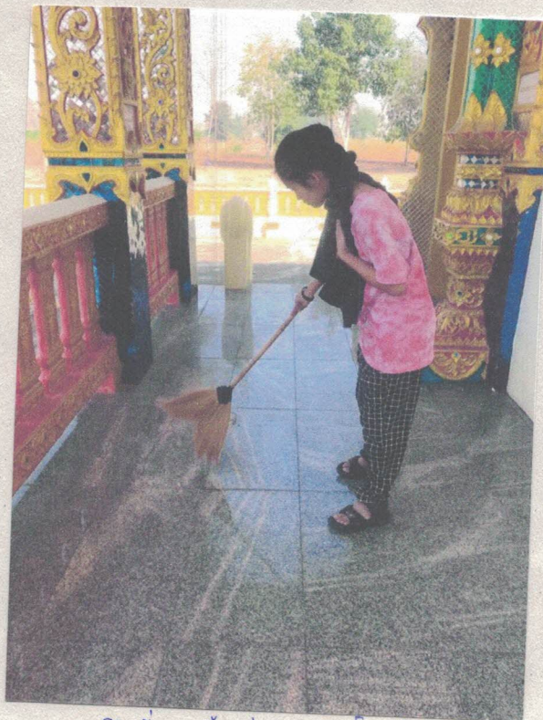
ภาพที่ 3 พื้นทางด้านนวงโบรด์