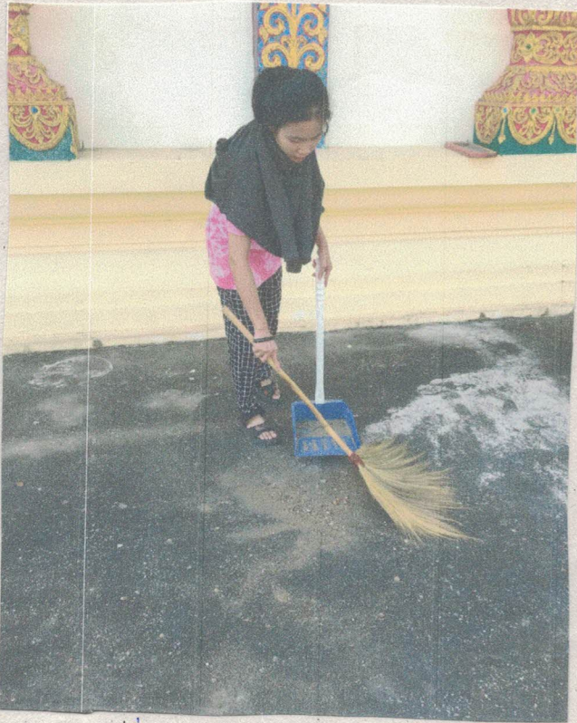
ภาพที่ 5 เก็บกวาดลานบริเวณโบสถ์