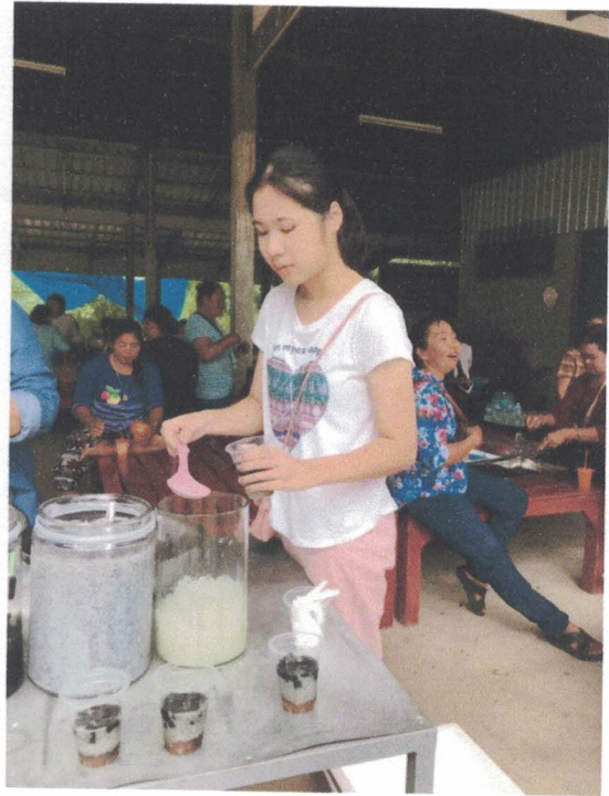
ทำโรงทานแจกน้ำแข็งไสแก่บุคคลที่มาร่วมงานประเพณีตานก๋วยสลาก ณ วัดเกาะแก้วทรายทอง เมื่อวันที่ 17 ตุลาคม 2562