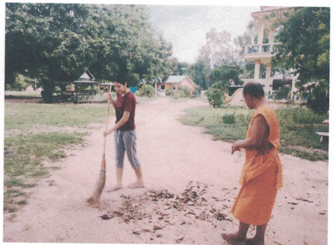
กวาดวัด ณ วัดเกาะแก้วทรายทอง ทุกวันเสาร์ อาทิตย์ในช่วงเย็น วันละ 1 ชม.