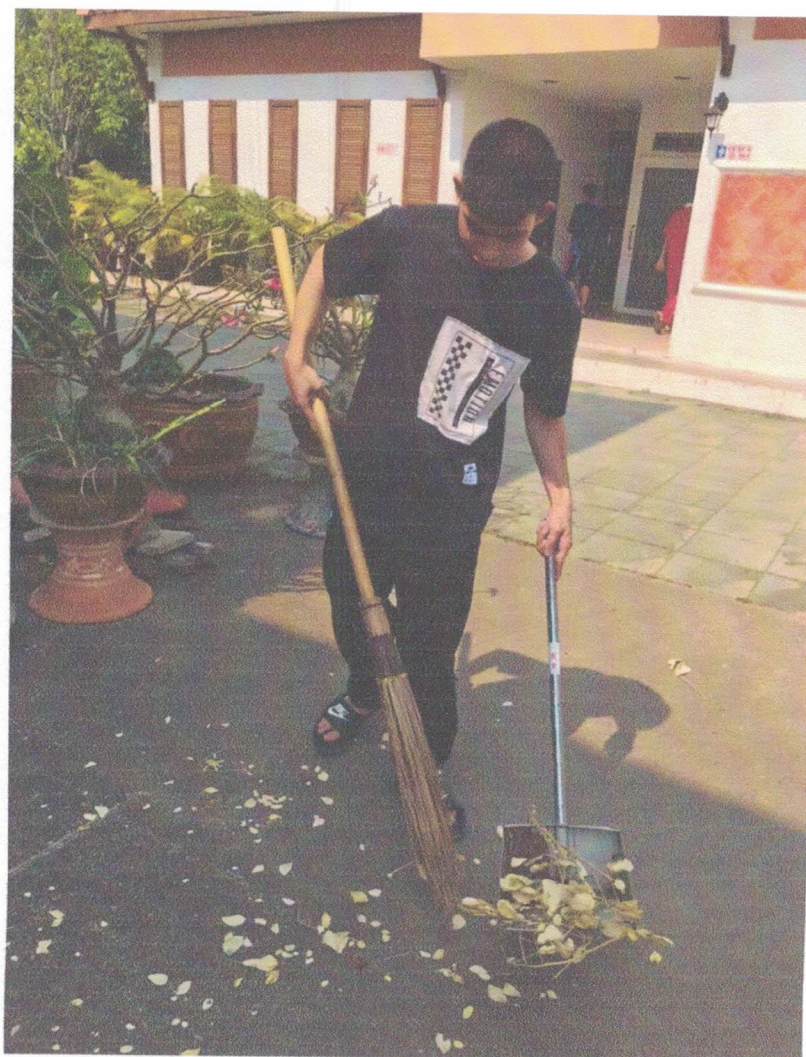
ภาคพื้นที่ยังมี การปรับปรุง ที่สะอาดเรียบร้อย