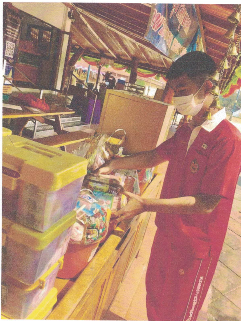
มีจุดสังเกต มาจัดวาง