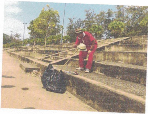
วันที่ 13 กุมภาพันธ์ 2563