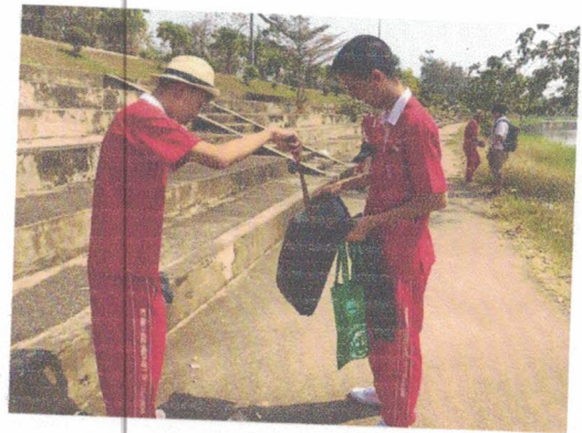
วันที่ 14 กุมภาพันธ์ 2563