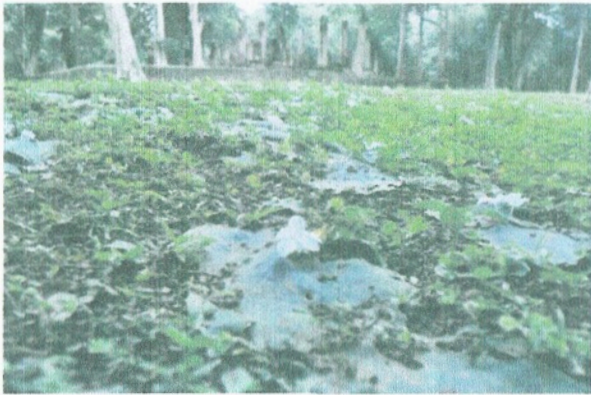
-เปราะหอมในอุทยานประวัติศาสตร์กำแพงเพชร

ต้นเปราะหอม จัดเป็นพืชล้มลุก มีอายุราวหนึ่งปี ทั้งเปราะหอมขาวและเปราะหอมแดง เป็นไม้ล้มหัวจันทน์หากาฬ มีลำต้นเป็นหัวอยู่ใต้ดิน หรือที่เรียกว่า "เหง้า" เนื้อภายในของเหง้ามีสีเหลืองอ่อนและมีสีเหลืองเข้มตามขอบนอก และมีกลิ่นหอมเฉพาะตัว มีรสเผ็ดขม เป็นพืชที่ชอบดินร่วนปนทราย มีความชุ่มชื้นพอเพียง เจริญเติบโตได้ดีในที่ร่ม เจริญเติบโตในช่วงฤดูฝน พออย่างเข้าฤดูหนาวต้นและใบจะโทรมไป และพบได้มากทางภาคเหนือ ขยายพันธุ์ด้วยวิธีการใช้เมล็ดหรือแยกหัว